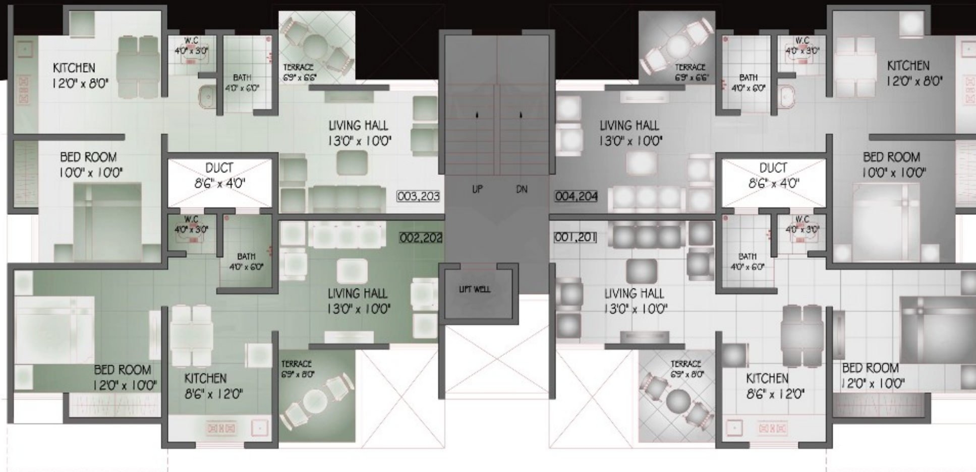
GROUND, SECOND ABOVE STILT FLOOR PLAN