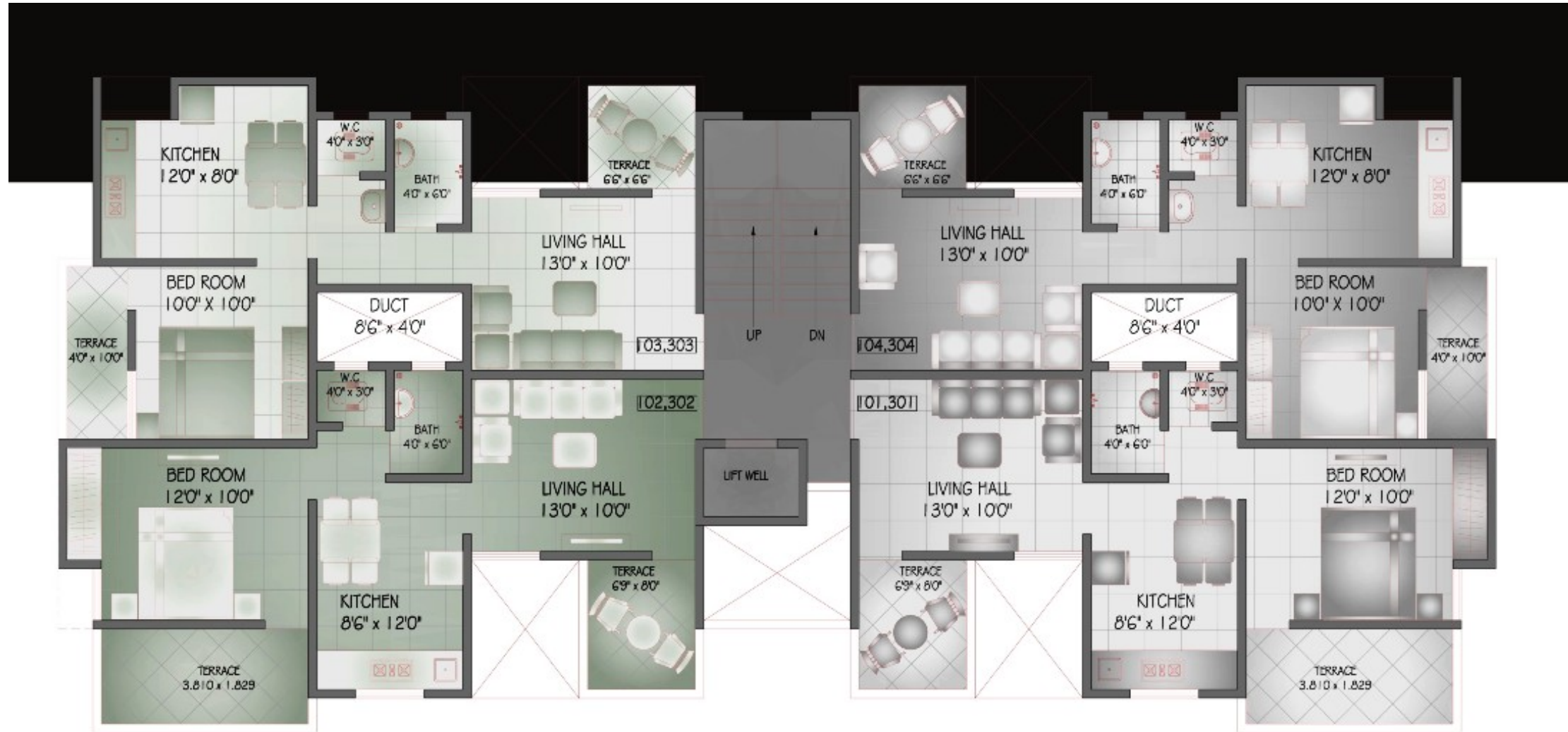
FIRST, THIRD ABOVE STILT FLOOR PLAN